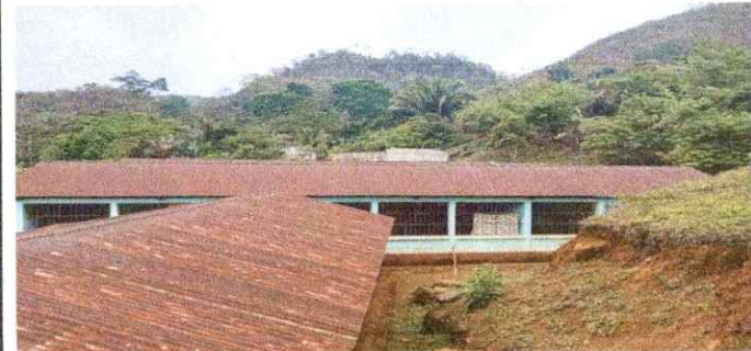
Foto 4: LAMINAS EN MAL ESTADO Y LE FILTRA EL AGUA EN TIEMPO DE INVIERNO AFECTANDO LOS EDUCANDOS