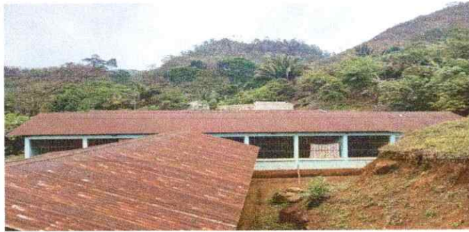
Foto1: LAMINAS EN MAL ESTADO Y DETERIORADO